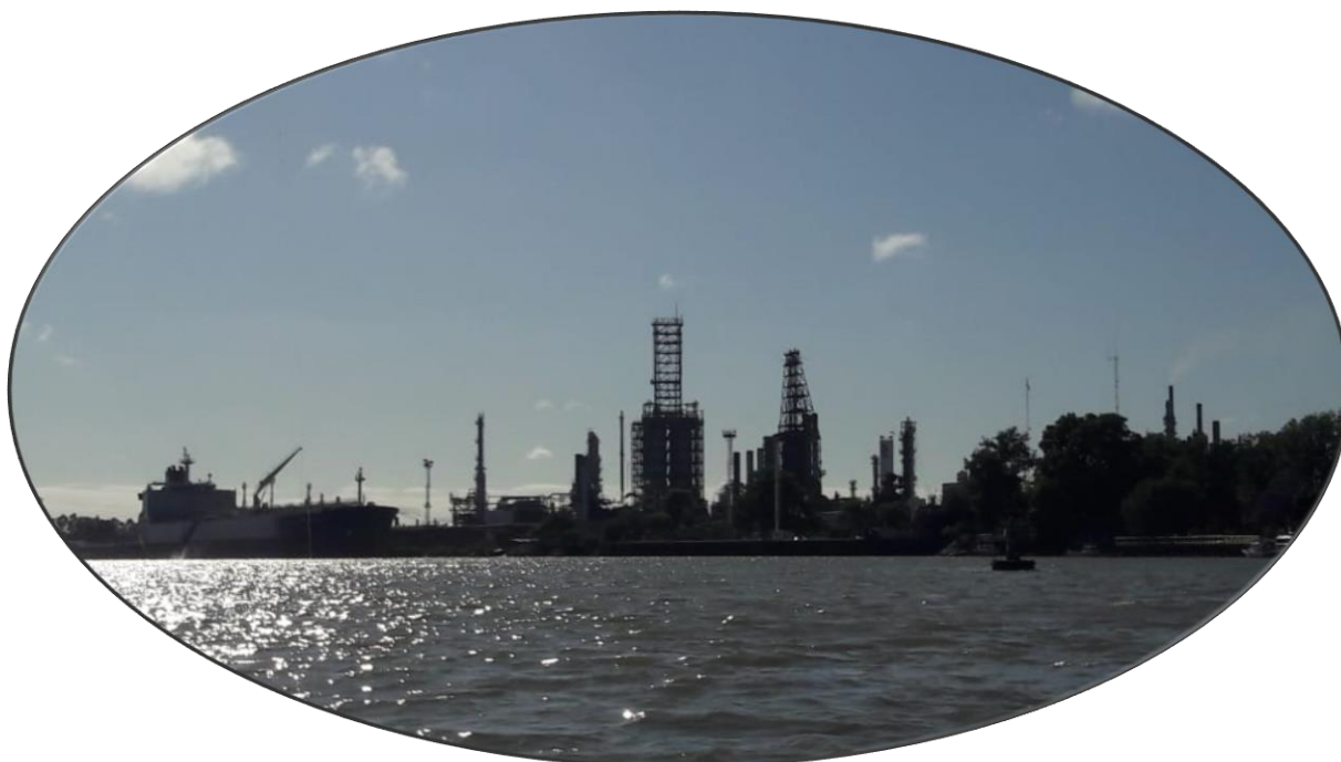
Paraná de Las Palmas - Campana Puerto Axion Energy y Muelle Fiscal

Campana - Argentine - 20, 21 et 22 octobre 2021