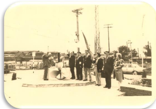
Emplazamiento del Monumento a los Marineros Mercantes.