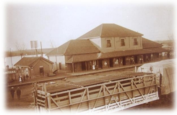
Estación de Ferrocarril de Campana. Combinación de medios de transporte carretero y fluvial.

Le patrimoine portuaire de la ville de Campana est un point de départ pour reconstruire son origine et son identité, et pour identifier les éléments matériels et/ou symboliques qui nous rapprochent d'un passé commun et riche. Cela passe par la valorisation de ce patrimoine historique et contribue ainsi à la construction de notre société actuelle.