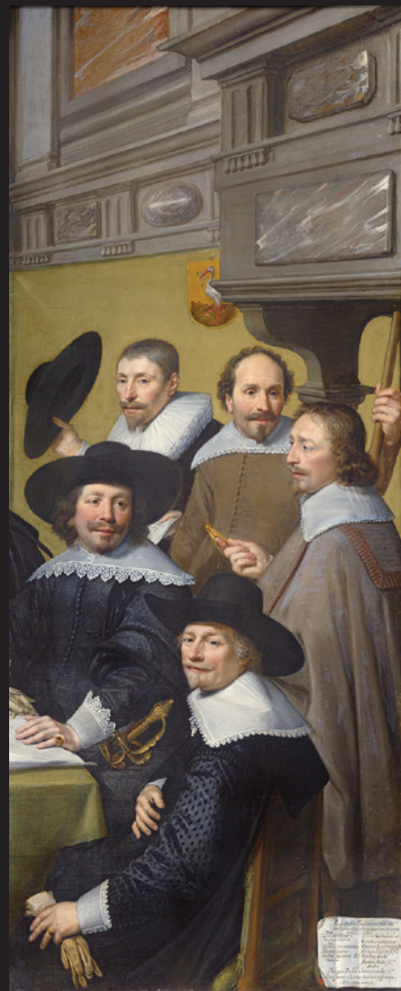
Jan van Ravesteyn, délibération du conseil municipal de La Haye relative à la reconstruction de la caserne Sebastiaansdoelen, 1636.